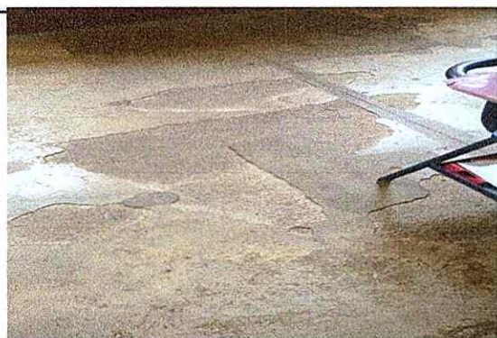
MODULO 3: PISO