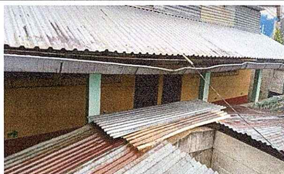
MODULO 4: CUBIERTAS Y CANALES DE AGUA PLUVIAL