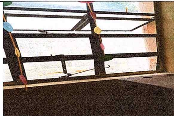
MODULO 2: SUSTITUCIÓN DE VENTANAS