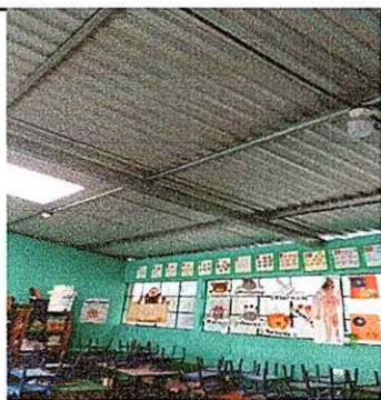
MODULO 5: REPARACION SISTEMA ELECTRICO.(todas las aulas les falta 1 foco para mayor visibilidad en tiempo de invierno)