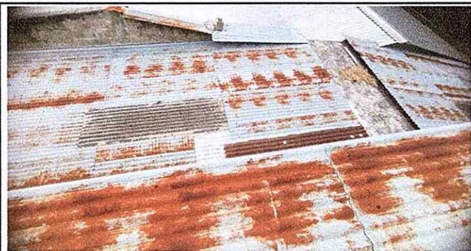
MODULO 1: CUBIERTA DE LAMINA